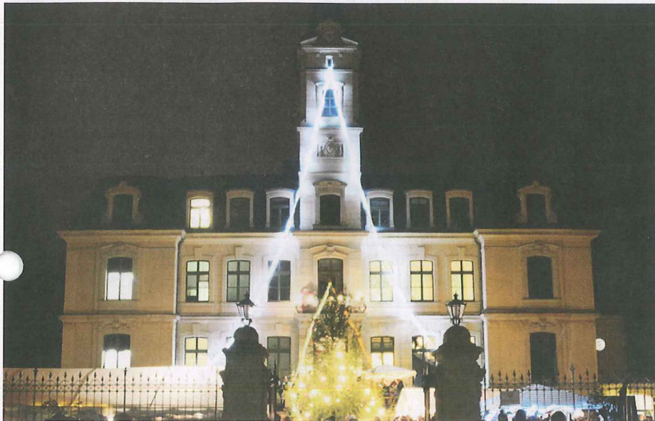
Einstimmung auf die Adventszeit: Das Schönfelder Schloss im Lichterglanz.